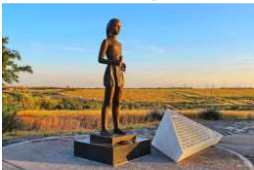
Солдатское поле г. Волгоград